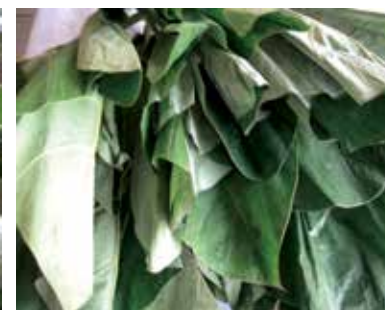
Feuilles de taro