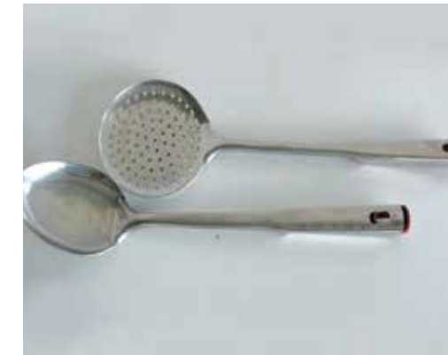
Une louche et un écumoire