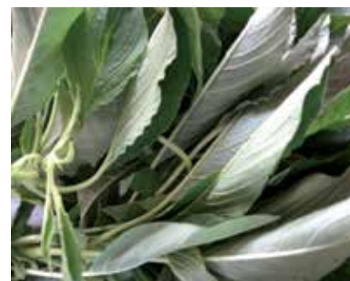
Amarante ou Bran brou