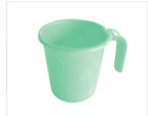
Gobelet de 100 ml