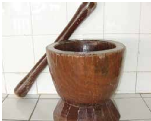
Différentes formes de mortier accompagnés de pilon