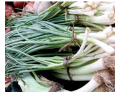
Ciboulette ou feuille d'oignons