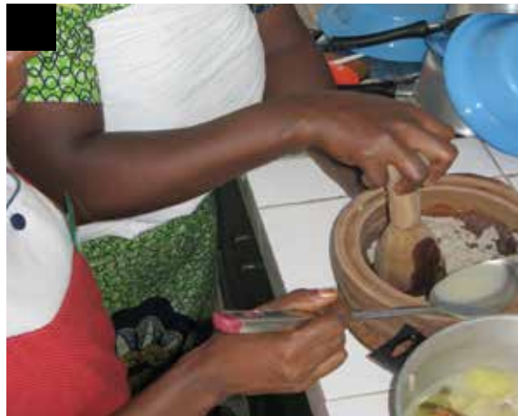
La mère écrase les ingrédients cuits.