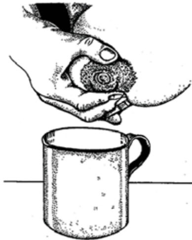
Fig. 1 Comment exprimer le lait maternel

a. Placer l'aréole entre l'index et le pouce et presser vers l'intérieur, vers la cage thoracique.