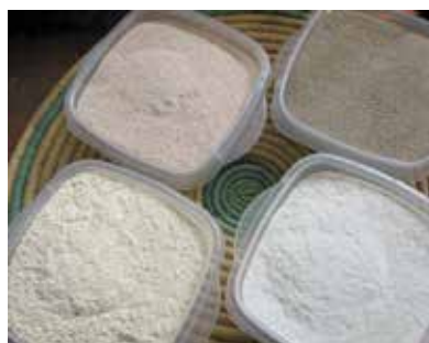
Farine de maïs, sorgho, mil, riz