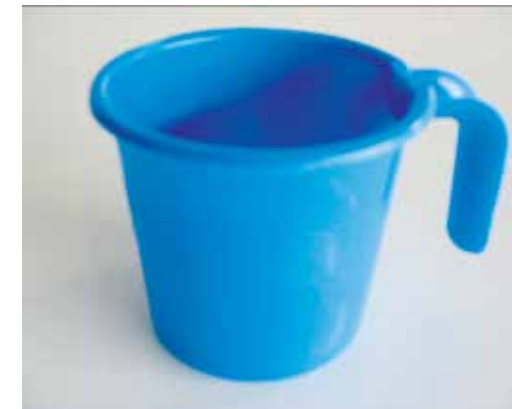
Gobelet de 350 ml