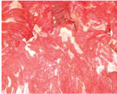
Viande de boeuf