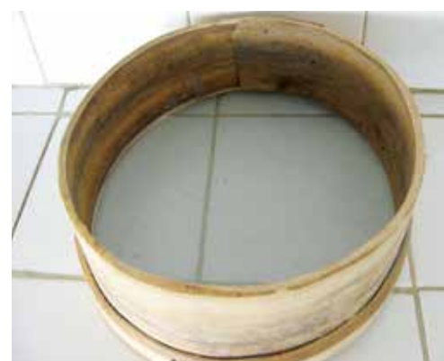
Un tamis artisanal