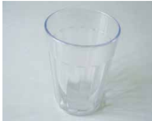
Verre de 240 ml avec un trait à 180 ml