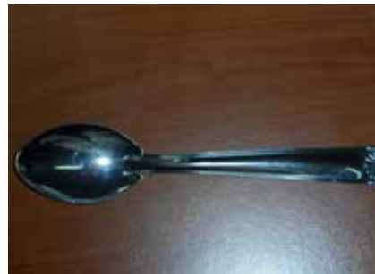
Cuillère à soupe (10 ml)