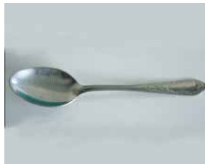
Cuillère à soupe (15 ml)