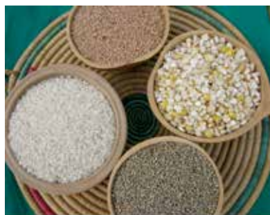
Riz, sorgho, maïs, mil