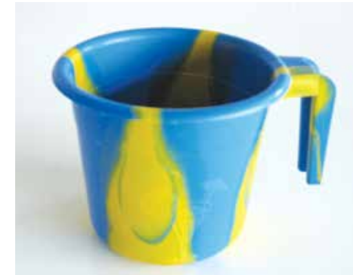
Gobelet de 240 ml avec un trait à 180 ml