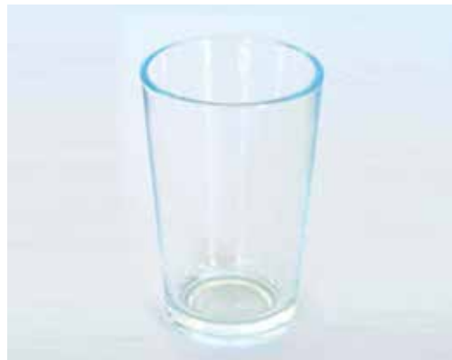
Verre de 100 ml