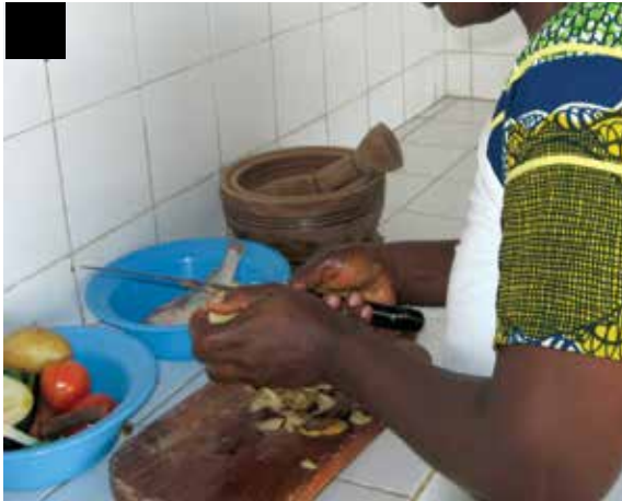
La mère apprête les aliments à préparer.