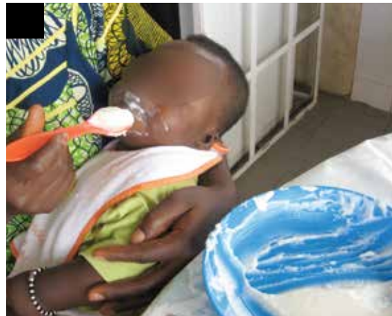
La mère donne à manger à son enfant avec patience.