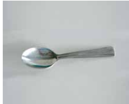
Cuillère à café (5 ml)