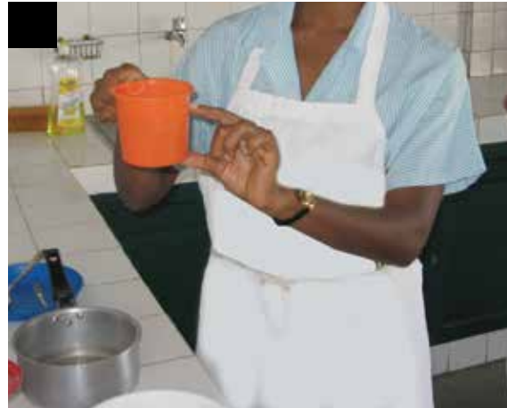
Le prestataire en nutrition en séance de démonstration pratique en présence de la mère. Le prestataire montre à la mère les quantités à utiliser.