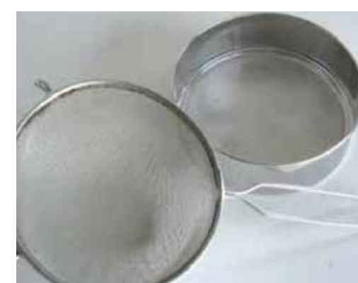
Des tamis modernes