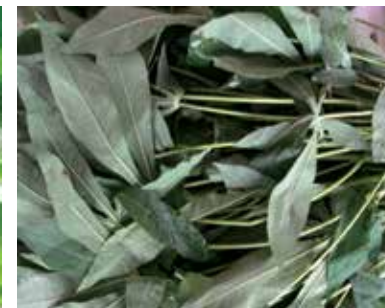
Feuilles de manioc