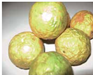
Fruit de la passion