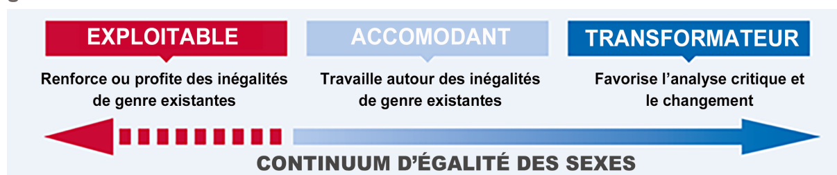
Figure 2. Continuum d'intégration du genre du Groupe de travail inter-agences sur le genre