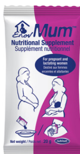
SQ-LNS pour la prévention